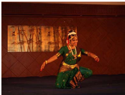
写真：インドの伝統芸能

National Institute of Youth Development を訪問し、コースディスカッションごとに分かれ、現地の青年との議論を行いました。また、現地の村を訪れ、NPO団体や小学校の視察を行いました。特に、小学校の生徒は貧しく、彼らのために何かをしたいとこの寄港地活動の直後からユニセフの募金活動を始めました（自主活動参照）。