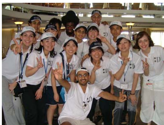
写真：スポーツにより一気に親近感が増す