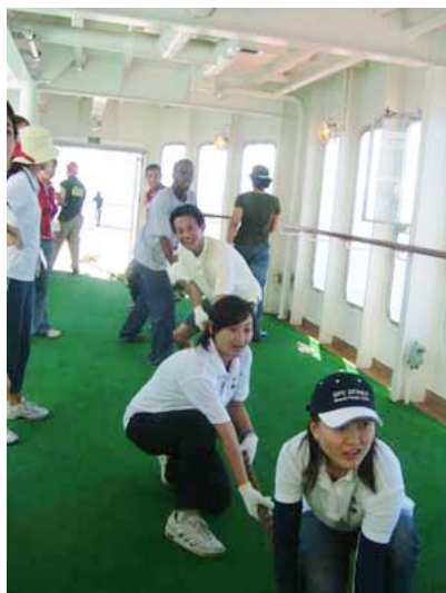
写真：綱引き（スポーツ）

各レターグループに分かれ、サッカー、綱引き、ドッジボールなどを行い、順位を競いあいました。一緒に体を動かし1つの目標を達成しようとする過程は、言葉だけではできない交流を実現します。