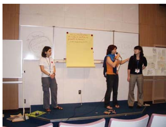
写真：ディスカッション成果の発表

国連コースでは、事前課題として3分間プレゼンテーションが課されていました。私は、「Should the WHO hire smokers?」（訳：WHOは喫煙者を採用すべきか?）というテーマでプレゼンテーションを行いました（別紙1）。また、プレゼンテーションの後は、小グループに分かれディスカッションを行いました。ディスカッションの最後にはまとめとして参加青年で簡単な劇を披露しました。