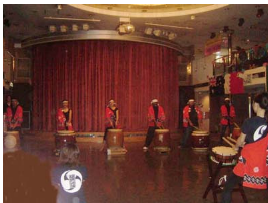
写真：和太鼓クラブの演舞

私はとても太鼓が好きになり、いつもクラブ活動の時間を楽しみにしていました。日本文化の再発見でした。船の中のエキササイズは限られていますが、太鼓は良いエキササイズにもなったと思います。