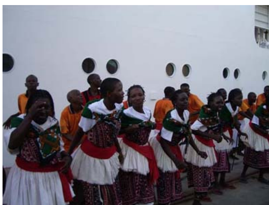
写真：ケニアでの歓迎ダンス

Training School for disable girl（障害のある少女たちの学校）を訪問し、現地の教育の様子を視察しました。少女たちは学校で裁縫やビーズでの小物作りを学んでいました。視察の最後に、少女たちが”We don't need sympathy, but opportunities!”（訳：同情はいらない、機会を与えて欲しい）という詩を力強く朗読していた姿が印象に残っています。