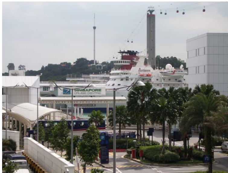
写真：にっぽん丸 in シンガポール