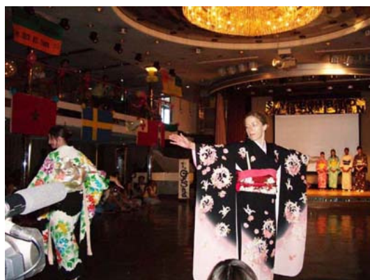
写真：芸者クラブ（エキシビション）