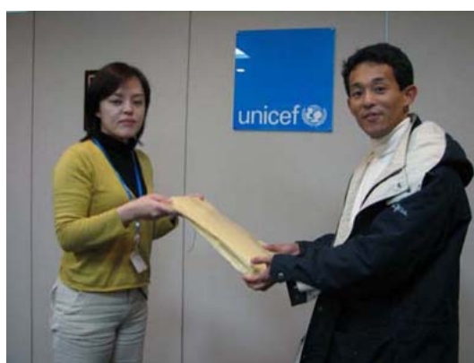
写真：ユニセフにて寄付を渡す(in Tokyo)

私も、“What Does Silence Mean?”ディスカッション、ユニセフ募金活動、“Mission Speak-up!”（別紙4）などを主催しました。