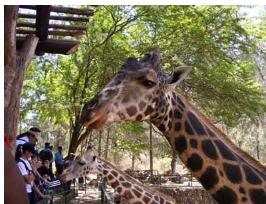
写真：Haller Park のキリン

また、Haller Eco-Park を訪問し、エコシステム回復プロジェクトを見学しました。この公園の周辺は、20世紀当初セメントの材料を採掘し、その結果土地が大変荒れてしまいました。その土地に草木を植え、動物を放し、エコシステムの回復を図るという