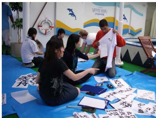
写真：習字（レターグループ活動）