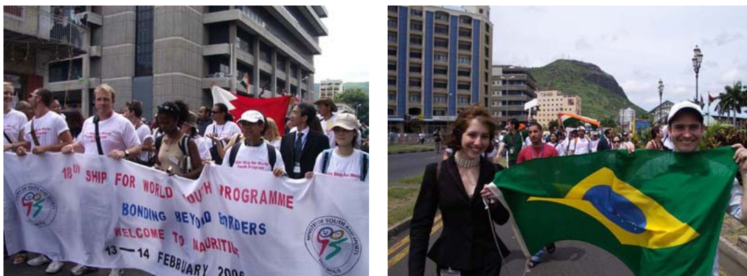
写真：ピースマーチ（ポートルイス）

また、モーリシャスの主産業である砂糖の博物館を見学しました。モーリシャスでは15種類の砂糖を作っており、それらの味比べをしたことが印象に残っています。15種類のうち2種類は、輸出をせずモーリシャスのみで販売をしているそうです。最後の水分を飛ばす過程の温度によって砂糖の色が変わります。茶色が濃くなればなるほど、温度が高いそうです。